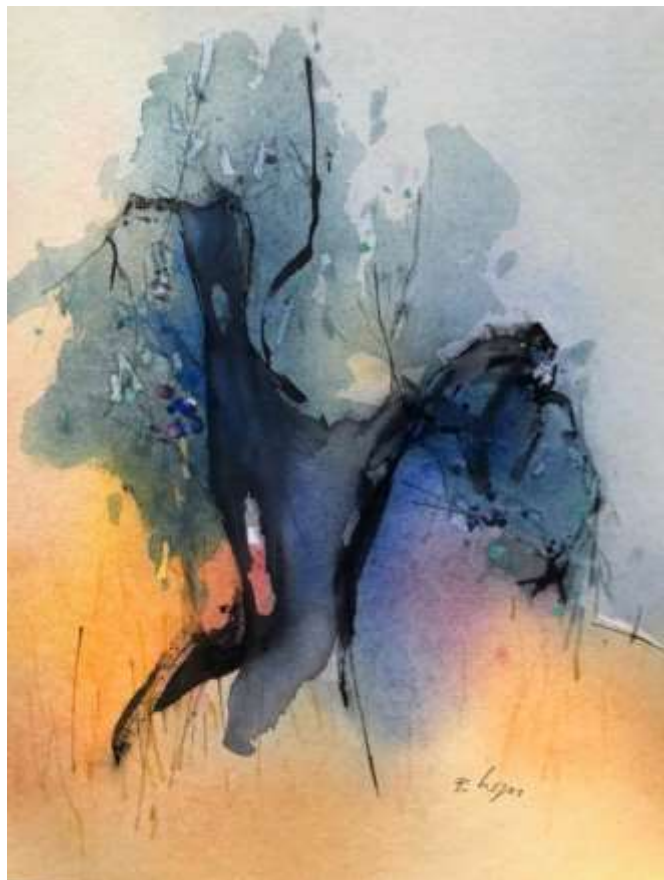
Paul Wyss «Olivenbaum»

Treffpunkt: Parkplatz Schützenmatte 13.30 Uhr Wer mit dem Auto fahren und noch andere mitnehmen könnte: bitte anmelden.