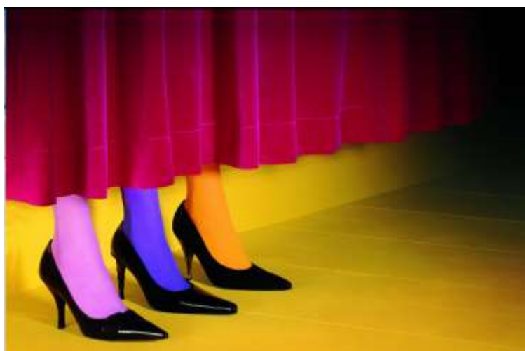
Miles Aldridge, Vogue Italia , 2002

Früher sah man Modefotografien nur auf den Seiten einer Zeitschrift oder vielleicht an der Wand eines Jugendzimmers. Doch das hat sich geändert: Museen veranstalten grosse Ausstellungen, Galerien und Auktionshäuser verkaufen Modebilder, und Verlage bringen ständig neue Publikationen heraus, die sich mit Modefotografie beschäftigen.